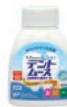
デントムース 詰め替え用ボトル