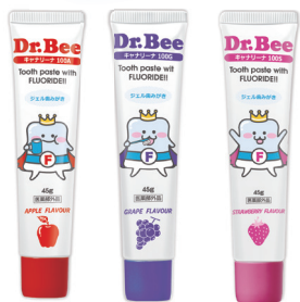
アップル グレープ ストロベリー