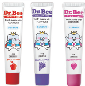
アップル グレープ ストロベリー