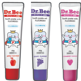
アップル グレープ ストロベリー