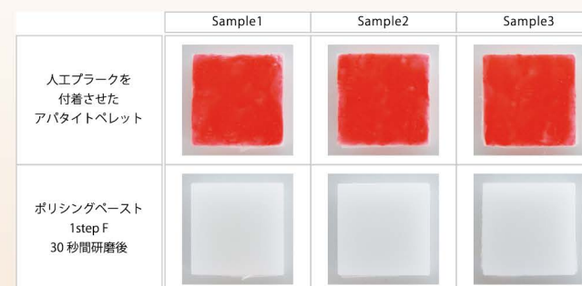
人工ブラークを付着させたアパタイトペレットに対する清掃効果

* 歯面の状態により、効果が異なる場合があります。実験の詳細は、弊社 web サイト (bee.co.jp) をご参照ください。