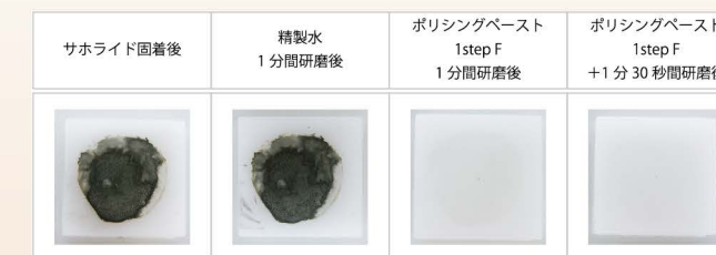
サホライド液歯科用 38% を固着させたアパタイトペレットに対する清掃効果

* 歯面の状態により、効果が異なる場合があります。実験の詳細は、弊社 web サイト (bee.co.jp) をご参照ください。