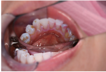
このように裏面の汚れまで一度でキレイになります。