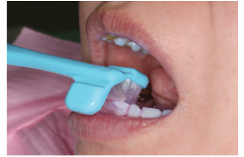
前歯も一度のストロークで表裏一緒に磨くことが可能です。