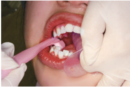
開口維持が困難な方でも奥歯まで簡単に磨くことができます。